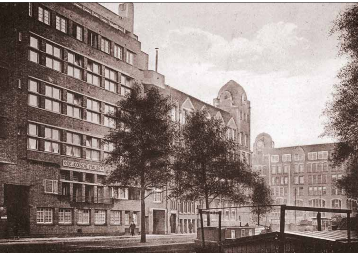
De Joodsche Invalide. Coll. Stadsarchief Amsterdam

Joodse onderduikers los, en nam het NSF de financiering over. Dit geld had echter niets te maken met de bevalling van Aalbers, waarvan De Wolff aan de hand van het operatieboek van het Julianaziekenhuis kon bewijzen daarbij helemaal niet aanwezig te zijn geweest.