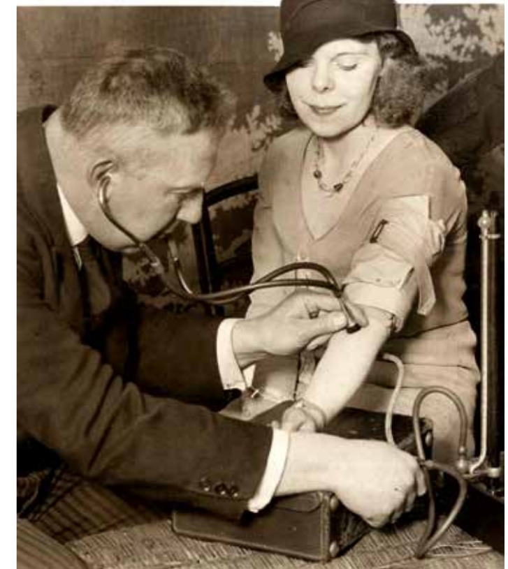
Een arts controleert een vrouw. Engeland, 1934.